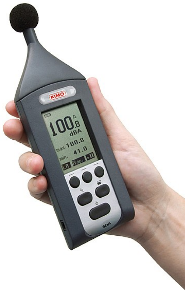
*Livré avec écran anti-vent

NE RIEN BRANCHER. Cette prise n'est pas une liaison USB, elle est réservée à la maintenance de l'instrument ou au branchement spécifique d'un accessoire en option.