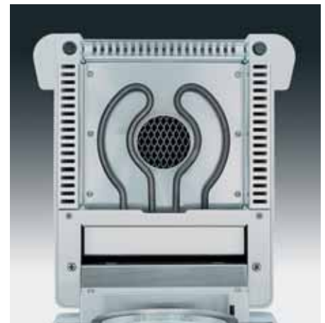
Elément chauffant à tube métallique avec réflecteur intégré pour une répartition uniforme de la chaleur

Le MA35 est le nouveau modèle de base de la série d'analyseurs d'humidité de Sartorius. Ses performances et son fonctionnement conviennent aux travaux quotidiens avec des échantillons toujours identiques, notamment dans le contrôle de la production et de la réception des marchandises. De par la limitation des options de programmation souvent superflues dans ces secteurs, le MA35 est facile à utiliser sans toutefois négliger la flexibilité et la précision de l'analyse.